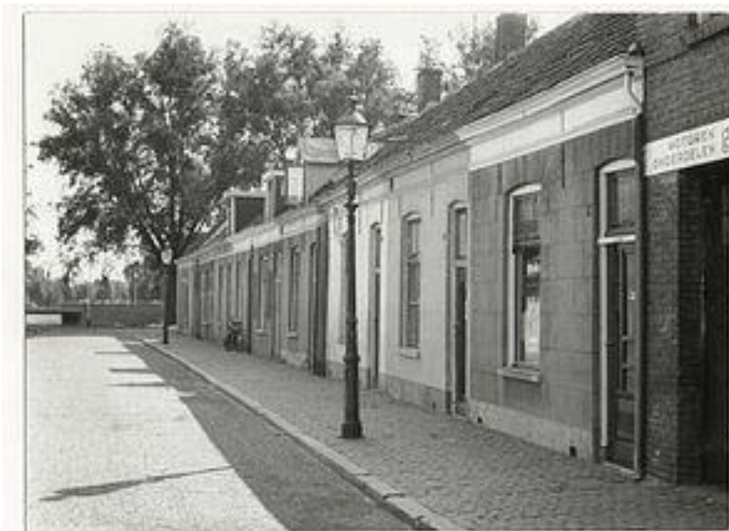
De hoek om bij ons: de Sluisstraat, richting school en badhuis