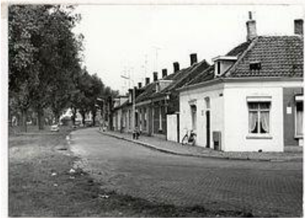
Het witte huis was ons huis